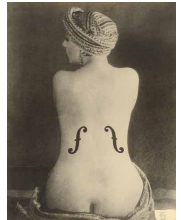
Man Ray, Le Violon d'Ingres, 1924 Courtesy of Institut für Kulturaustausch, Tübingen © Man Ray Trust, Paris/ VG Bild-Kunst, Bonn 2023