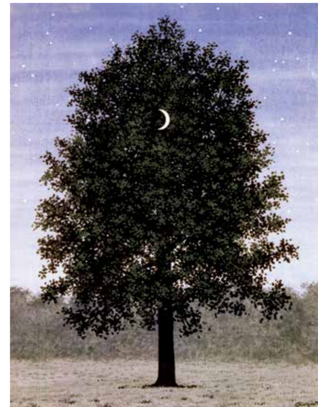
René Magritte, Arbre et Lune, 1948

Kunsthalle Vogelmann, Allee 28, 74072 Heilbronn und Wein Villa, Cäcilienstraße 66, 74072 Heilbronn Buchung: Tel. +49 7131 56 41 03 | buchungen@heilbronn-marketing.de Code: BX100.039