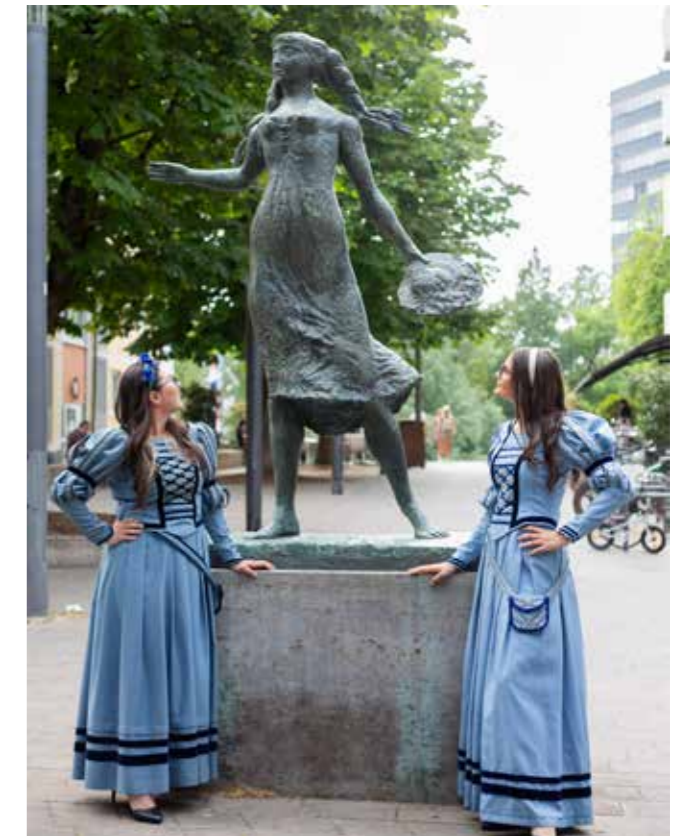
Franzi und Enni vor der Käthchenskulptur von Dieter Läßle