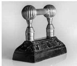
Mutmaßlicher Türgriff der 1938 zerstörten Synagoge Heilbronn.