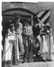
Benediktine vor dem Schloßküchlein