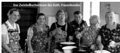
Das Zwiebelkuchenteam des Kath. Frauenbundes