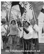
Die Schloßwache marschiert auf