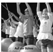
Auf der Bühne