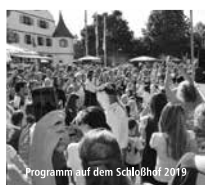
Programm auf dem Schloßhof 2019