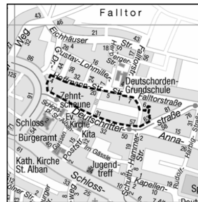
Kartengrundlage Vermessungs- und Katasteramt

Der Geltungsbereich ist im Lageplan des Planungs- und Baurechtsamts vom 11.02.2022 umgrenzt und umfasst folgende Flurstücke: