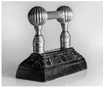
Mutmaßlicher Türgriff der 1938 zerstörten Synagoge Heilbronn.