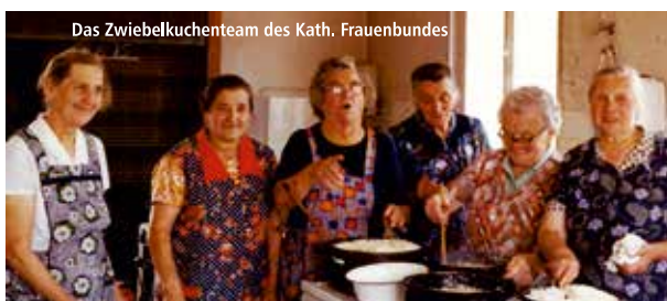
Das Zwiebelkuchenteam des Kath. Frauenbundes