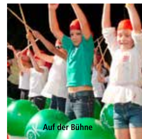
Auf der Bühne