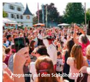
Programm auf dem Schloßhof 2019