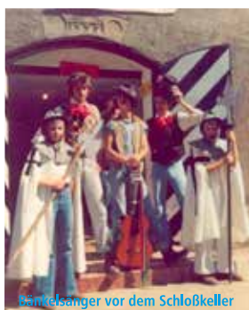
Wirtelsänger vor dem Schloßkeller