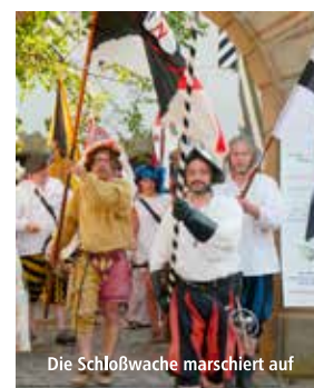
Die Schloßwache marschiert auf