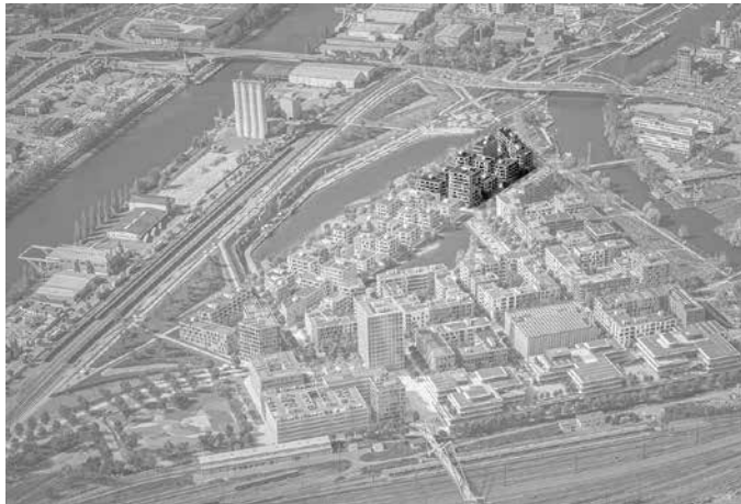
Visualisierung des Neckarbogens nach der vollständigen Auf-siedlung. Hervorgehoben sind hier die Baufelder F und G. Visualisierung: Stadt Heilbronn

Für die Öffentlichkeit werden alle eingereichten Arbeiten am Freitag und Samstag, 17. und 18. Mai, in einer Ausstellung präsentiert. Gezeigt wird sie am Freitag von 12 bis 18 Uhr und am Samstag von 10 bis 15 Uhr in der neuen Innovationsfabrik 2.0 im Zukunftspark Wohlgelegen.