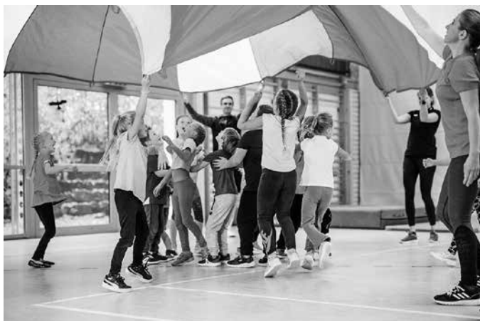
Kinder der TSG-Kindersportschule KISS in Aktion.

Weitere Informationen zur TSG-Kindersportschule KISS unter: tsg-heilbronn.de/kiss