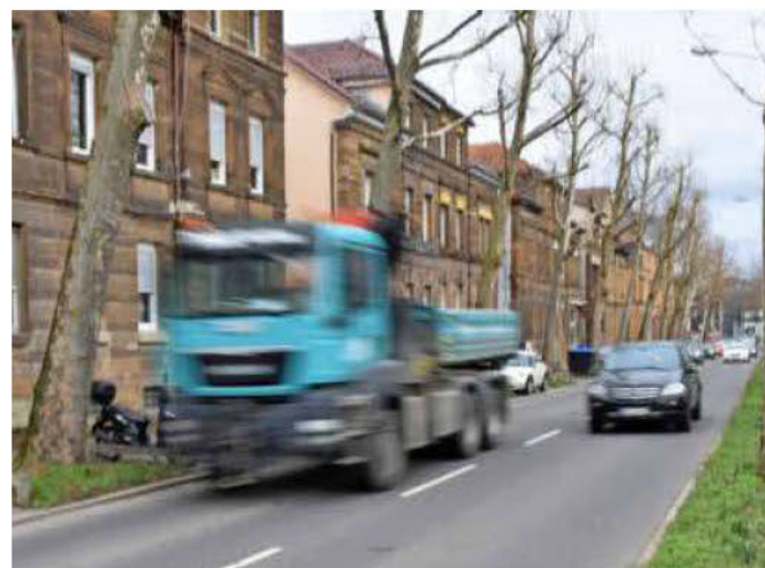
Für die Anwohner der viel befahrenen Südstraße wird es nach dem Aufbringen des lärmarmen Asphalts deutlich leiser.