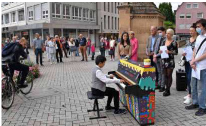
Bunt gestalte Klaviere laden zum Musizieren ein: Auch in diesem Jahr wird es diese Aktion wieder geben.

INFO: Für die Gestaltung stehen pro Klavier 200 Euro inklusive Material zur Verfügung. Welche Projektideen realisiert werden, entscheidet Anfang März eine Jury. Die Gestaltung der Klaviere erfolgt vom 23. März bis zum 20. Juni. Detaillierte Informationen zum Gestaltungswettbewerb finden Interessierte unter www.heilbronner-buergerstiftung.de . Einsendeschluss für die Bewerbung ist Montag, 28. Februar.