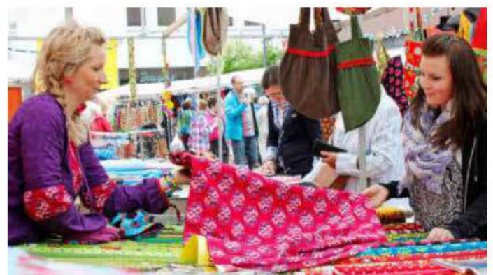
Der Deutsch-Holländische Stoffmarkt verwandelt die Untere Neckarstraße am Samstag, 5. März, 10 bis 17 Uhr, in ein buntes Stoffparadies.

Starke Frauen. Dienstag, 8. März, 18 Uhr, Robert-Mayer-Denkmal.