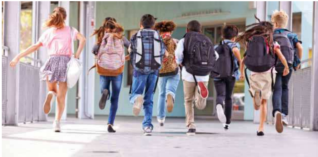
Die Grundschule ist bald vorbei, doch: Wie geht es nun weiter?