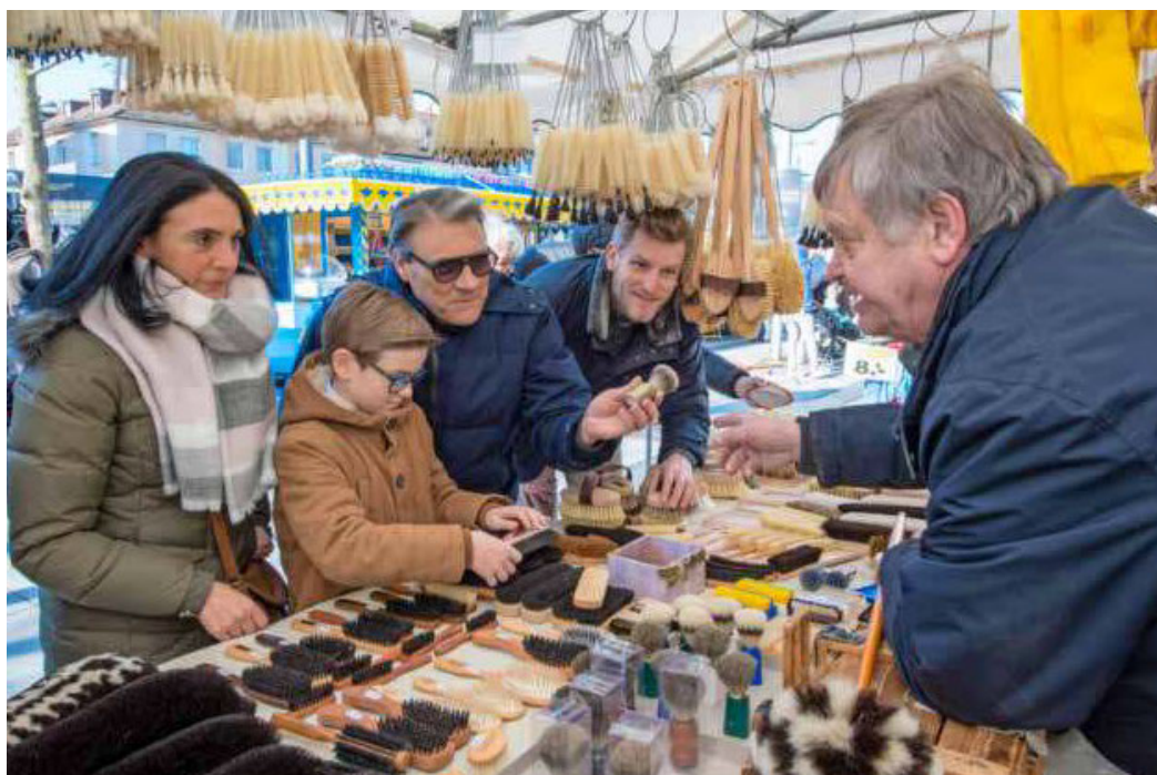
In drei Tagen beginnt der Pferdemarkt: Krämermarkt und Funpark weichen coronabedingt auf die Theresienwiese aus, die Pferdeprämierungen finden am Trappensee statt.

INFO: Ansprechpartnerin für die Anmeldung zum Lehrgang oder bei Fragen ist Serpil Seven, Stabsstelle Partizipation und Integration, unter Telefon 07131 56-4537 oder per E-Mail an: serpil.seven@heilbronn.de.