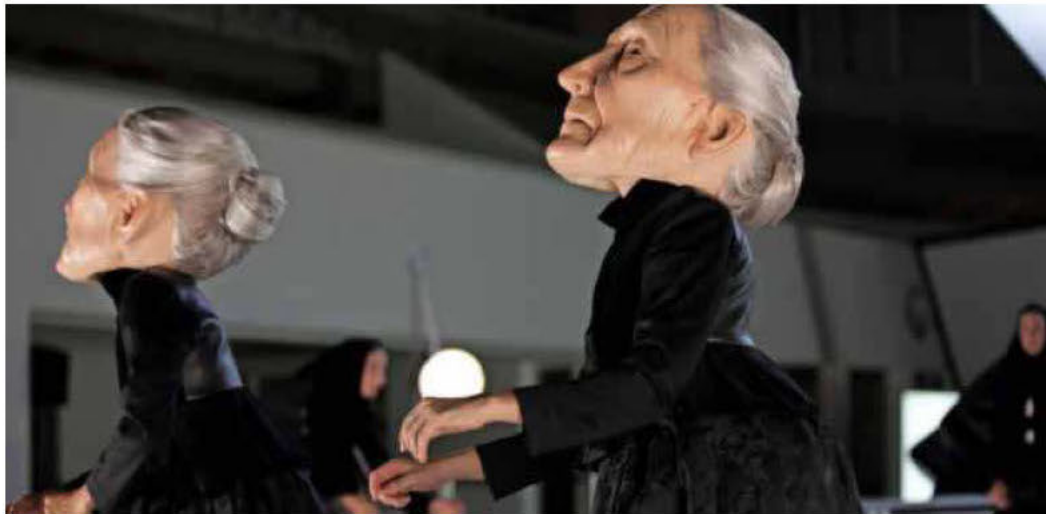
Eine Hommage an die spanische Kultur ist das poetische Werk „Sonoma“, das die spanische Kompanie La Veronal am 21. Mai im Großen Haus des Theaters zeigt.