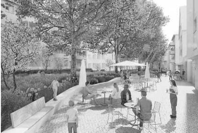
Visualisierung der Sanierungsvorschläge für die Turmstraße sowie Zehentgasse

An Planungskosten hat der Gemeinderat 580.000 Euro bewilligt. In der ersten Vergabestufe sind 205.000 Euro für die Grundlagnermittlung, Vor- und Entwurfsplanung vorgesehen.