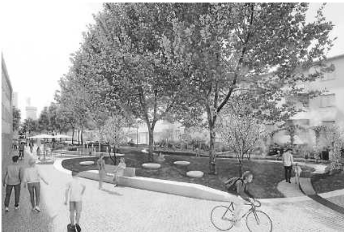
Visualisierung der Sanierungsvorschläge für die Turmstraße sowie Zehentgasse