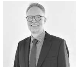
Patrik Henschel freut sich nach der Wahl auf die neuen Aufgaben bei der Stadt Heilbronn

Als Amtsleitung zeichnet er damit für die Abteilungen Baurecht, Planung sowie den Umwelt- und Arbeitsschutz verantwortlich.