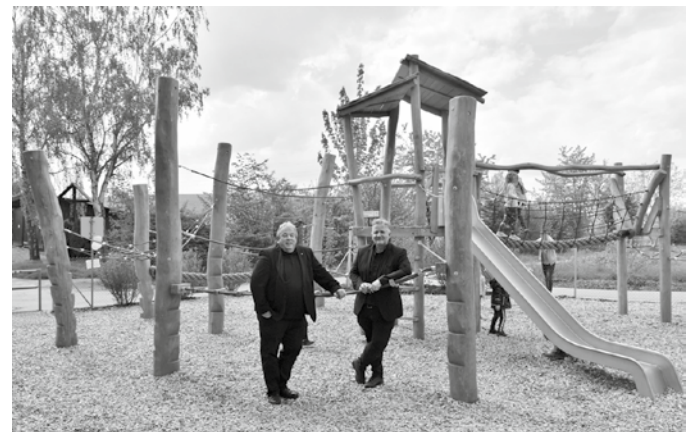
Baubürgermeister Wilfried Hajek (l.) und Grünflächenamtsleiter Oliver Toellner eröffneten zusammen mit zahlreichen Kindern den Kinderspielplatz Wittumäcker-West II ein.

Toellner überzeugen, die das neue Spielparadies im Wohngebiet Wittumäcker-West II ganz im Südwesten von Kirchhausen zusammen mit zahlreichen Kindern und Mitgliedern des Gemeinde- und Bezirksbeirats eröffnet haben. Insgesamt hat die Stadt Heilbronn etwa 240.000 Euro in die Neugestaltung investiert.