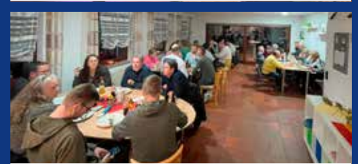
Saisonabschluss beim Tennisclub Kirchhausen