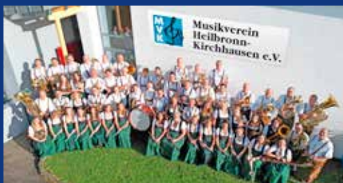
Der Musikverein in voller Besetzung

Ein Jahr mit Auf und Abs geht zu Ende und ein Jahr mit vielen Unbekannten steht bevor. Genießen wir deshalb die besinnliche Jahreszeit um Weihnachten mit der Familie und Freunden und tanken Kraft für das was kommt. Gemeinsam werden wir die anstehenden Herausforderungen meistern.