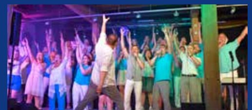
Sunrise Chor bringt die Zehntscheune zum Beben