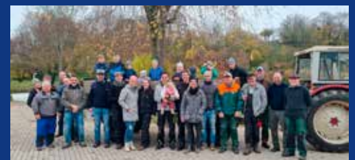
Fleißige Helfer beim Einwintern im Freibad

Ihr Bürgeramt und Bezirksbeirat im Stadtteil Kirchhausen