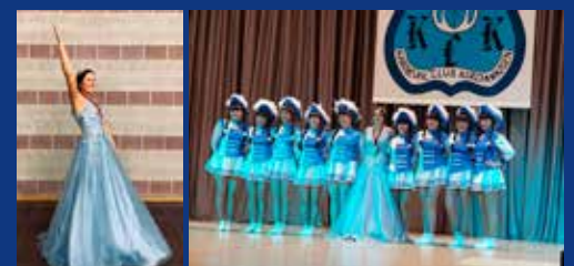
Beim KCK ist immer was los