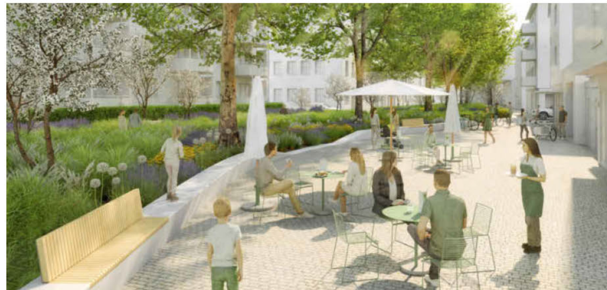
Auch in der Zehentgasse ist deutlich weniger Verkehr als heute denkbar. Stattdessen könnten ebenfalls Grün- und Freiflächen die Aufenthaltsqualität stärken. Visualisierungen: ARGE Biegert Hink sowie Raumlabor 3/Thorsten Kraemer

Eine Ausstellung im Wollhaus zeigt alle zwölf eingereichten Arbeiten, der Zugang ist barrierefrei und erfolgt von der Fußgängerzone. Die Ausstellung ist bis zum 21. Juli montags bis freitags von 13 bis 17 Uhr und samstags von 11 bis 15 Uhr geöffnet. Der Eintritt ist frei.