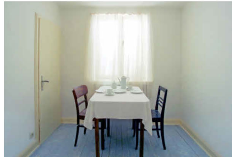
Das Projekt u r 10, Kaffeezimmer, aus dem Jahr 1993.

INFO: Die Ausstellung Gregor Schneider in der Kunsthalle Vogelmann, Allee 28, ist bis zum 29. Oktober dienstags bis sonntags von 11 bis 17 Uhr (donnerstags bis 19 Uhr) zu sehen. https://museen.heilbronn.de/kunsthalle-vogelmann