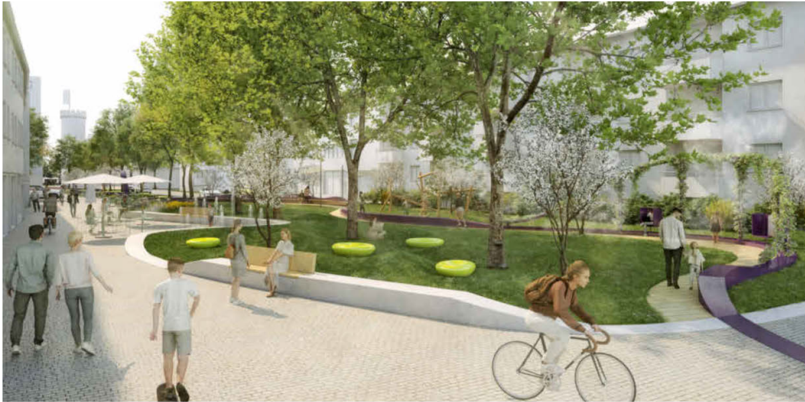
Wo heute noch der Verkehr dominiert, könnte in einigen Jahren eine grüne Oase entstehen. Durch die Entsiegelung von Asphaltflächen und ein intelligentes Regenwassermanagement würden klimatisch kühle Orte in der hitzebelasteten Stadt entstehen.