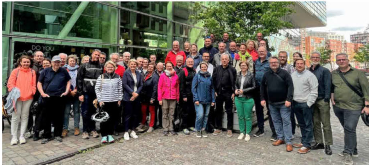
Der Heilbronner Gemeinderat besuchte auf seiner Fachstudienreise die niederländische Hauptstadt Amsterdam.

Autos sollen in Zukunft immer mehr aus der Amsterdamer Innenstadt verdrängt werden. Schon heute sind die Menschen in der 930 000 Einwohner zählenden Metropole vor allem mit dem Fahrrad unterwegs. Allein unter dem Hauptbahnhof steht eine Parkanlage zur Verfügung mit 30 000 kostenlosen Stellplätzen. (pin)